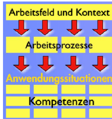
Aufbau des Berufsprofils

Dem vorliegenden Rahmenlehrplan liegt der in der nachfolgenden Abbildung dargestellte Aufbau zu Grunde: