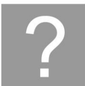
??? Siegerin / Sieger 2018